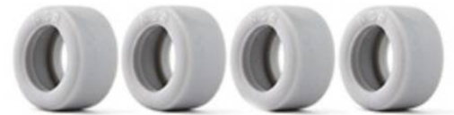
5257 Slick WRE rear 20x10

11.2 Alternativ: NSR Reifen Best.-Nr. 5257 (16")/5258 (17"), welche geklebt, leicht geschliffen und poliert werden dürfen, um eine Chancengleichheit mit den 9030/9031 zu haben.