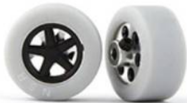
9030 Rear trued rubber WRE tires 20x10

11.1 NSR Fertigreifen Best.-Nr.: 9031 – 20x11mm –