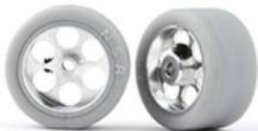
9031 Rear trued rubber GT3 tires 20x11

11.2 Alternativ: NSR Reifen Best.-Nr. 5257 (16")/5258 (17"), welche geklebt, leicht geschliffen und poliert werden dürfen, um eine Chancengleichheit mit den 9030/9031 zu haben.