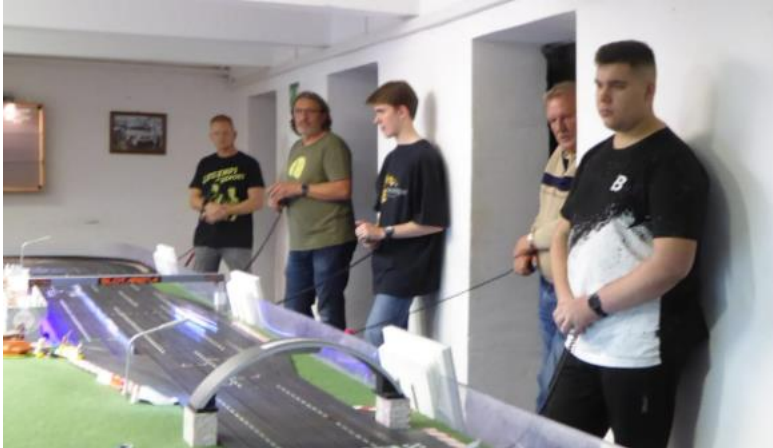
Die Schlussfahrer ...